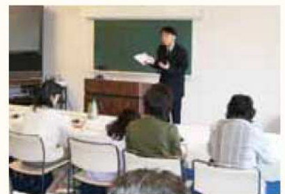
「羊羹のおいしさ」講座の様子